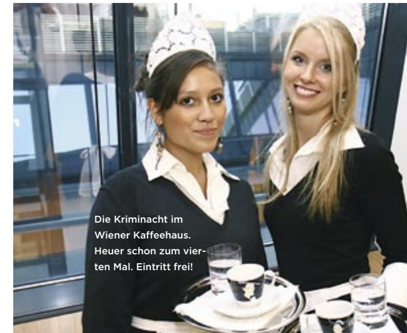
Die Kriminacht im Wiener Kaffeehaus. Heuer schon zum vierten Mal. Eintritt frei!