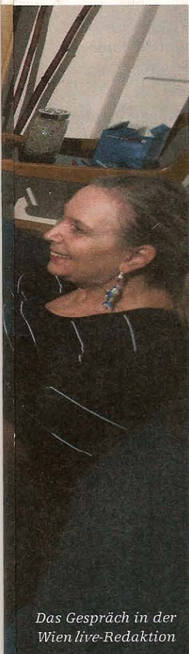
Das Gespräch in der Wien live-Redaktion